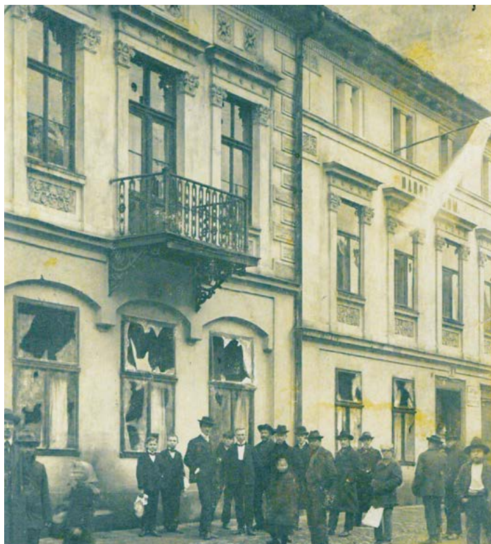
Národní dům po útoku německých nacionalistů v roce 1909.

Česká menšina v Novém Jičíně se však potýkala i s vnitřními problémy. Mezi samotnými představiteli národního života docházelo k roztržkám a neshodám, navíc se nedařilo navázat výraznější spolupráci s českým venkovem. Místní Češi se ke své národnostní příslušnosti z valné většiny hlásili jen vlažně a ve svém vlastenčení se chovali nedůsledně. Podle stížností i přes výzvy dále nakupovali v německých obchodech, využívali služeb německých řemeslníků,