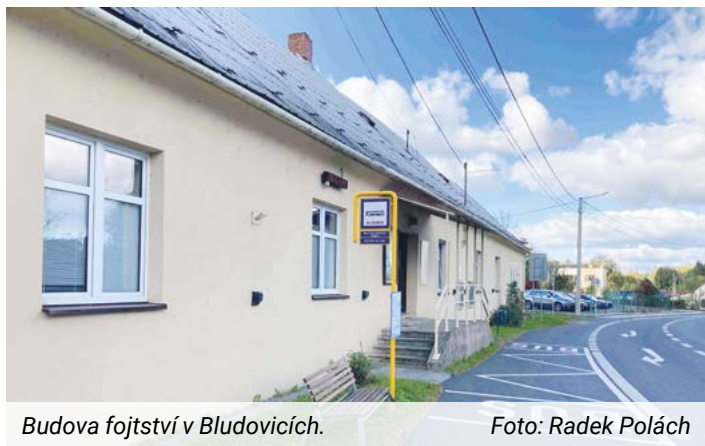
Budova fojtství v Bludovicích.