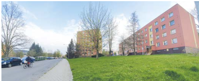
Na snímku je místo, kde budou na sídlišti Nerudova vybudovány parkovací kapsy.

Nový Jičín získal dotaci na druhou etapu regenerace panelového sídliště Nerudova. Ta je naplánována na příští rok a bude obsahovat rozšíření počtu parkovacích míst, výměnu a doplnění veřejného osvětlení, dodání nového mobiliáře, vybudování dětských hřišť a obnovu zeleně. Předpokládané náklady byly vyčísleny na 8,6 milionu korun. Část výdajů pokryje dotace z evropských fondů IROP ve výši 2,5 milionu korun.