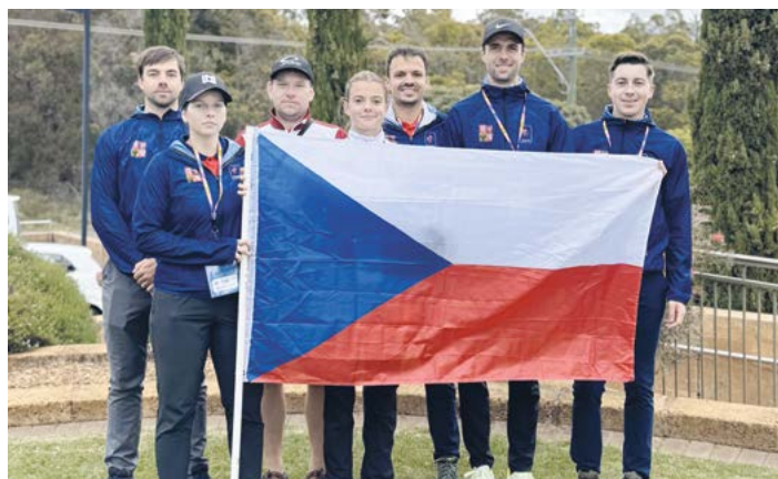
Česká discgolfová reprezentace na týmovém mistrovství světa v australském Perthu.