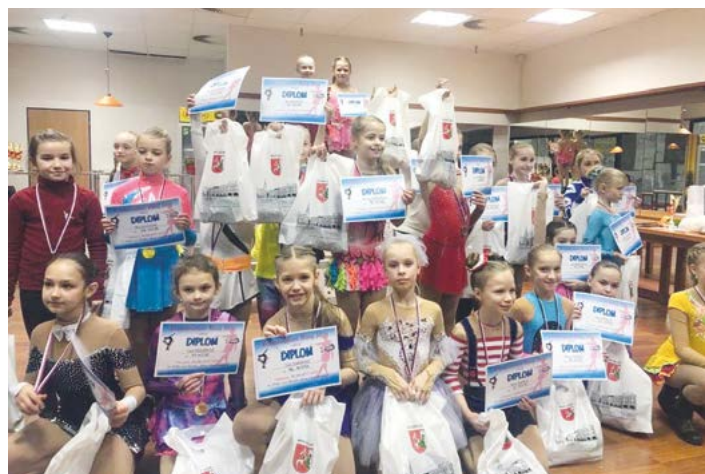
Lednová Velká cena Nového Jičína v krasobruslení – vyhlášení výsledků jedné z kategorií.