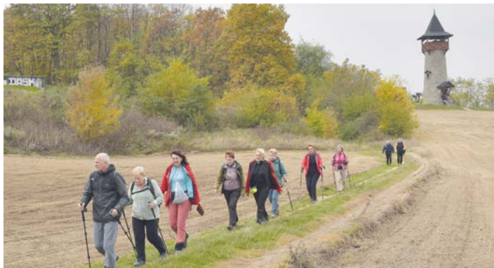
Rozhledna na hřebeni.