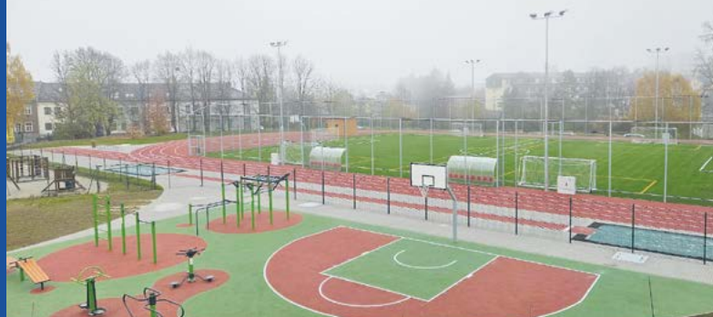
Současná podoba školního hřiště.

Součástí obnovy sportoviště je také umělé osvětlení, nový mobiliář a sportovní vybavení. „Podobně jako u ZŠ Dlouhé máme v plánu otevřít areál také široké veřejnosti v odpoledních hodinách a o víkendech a o prázdninách po celý den. Fotbalové hřiště pak bude k dispozici