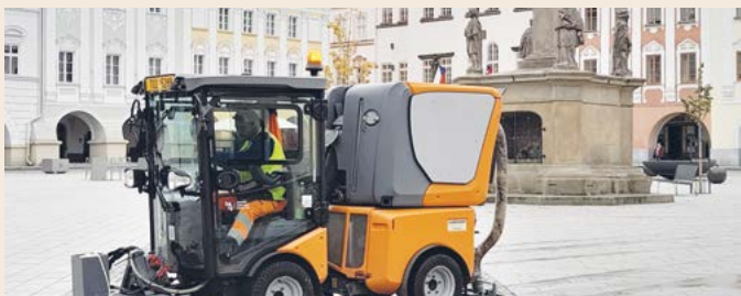
Pracovník technických služeb umývá strojem plochu náměstí.

Nový Jičín každoročně vynaloží přibližně dva a půl milionu korun na úklid Masarykova náměstí a přilehlých ulic.