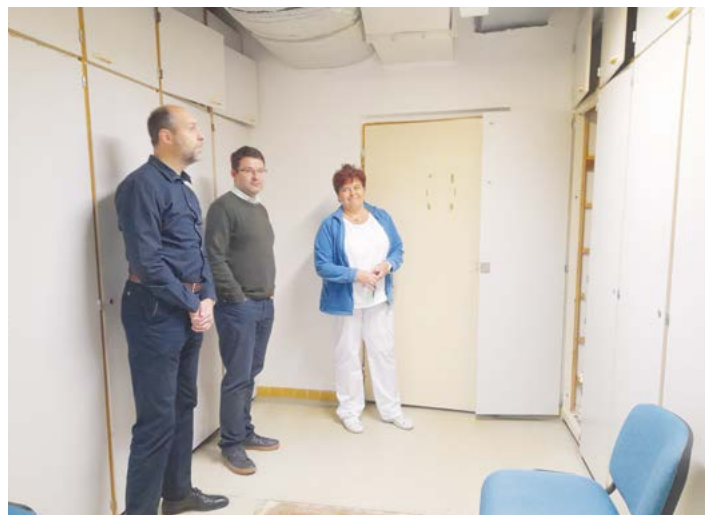
Místostarostové si prohlížejí šatnu kuchařek.

Členové vedení města si prohlédli prostory Základní školy Tyršova Nový Jičín. Návštěvou této instituce dovršili svůj plán zavítat do všech novojičínských škol zřizovaných městem. Představitel radnice se seznámili s potřebami škol, ale také s úspěšnými projekty. V ZŠ Tyršova byla stěžejním tématem potřeba nové tělocvičny a rekonstrukce zázemí pro kuchařky školní kuchyně.