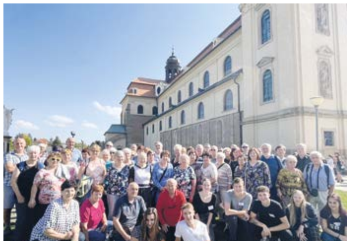
Loňský zájezd seniorů na Velehrad.