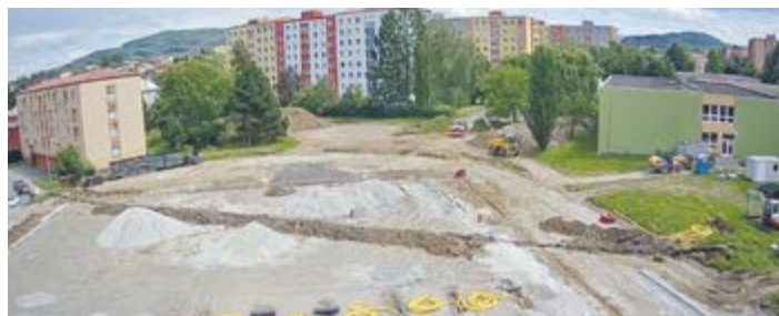
Opravované hřiště za ZŠ Komenského 66 a 68.

Město i letos pokračuje ve své dlouhodobé snaze o zajištění bezpečného a příjemného prostředí pro děti, a to prostřednictvím pravidelných investic do údržby a oprav dětských hřišť. Na opravu a údržbu 72 dětských hřišť jsou v rozpočtu města každoročně vyčleněny prostředky ve výši zhruba 2 miliony korun. Do tohoto počtu ani finančního objemu nejsou započítána školní hřiště, která jsou taktéž přístupná veřejnosti, a jejichž správu a údržbu zajišťují příslušné školy.