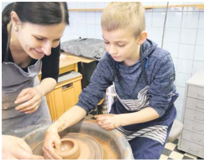
Výtvarná výchova v 5. A je doplněna také činnostmi v keramické dílně.