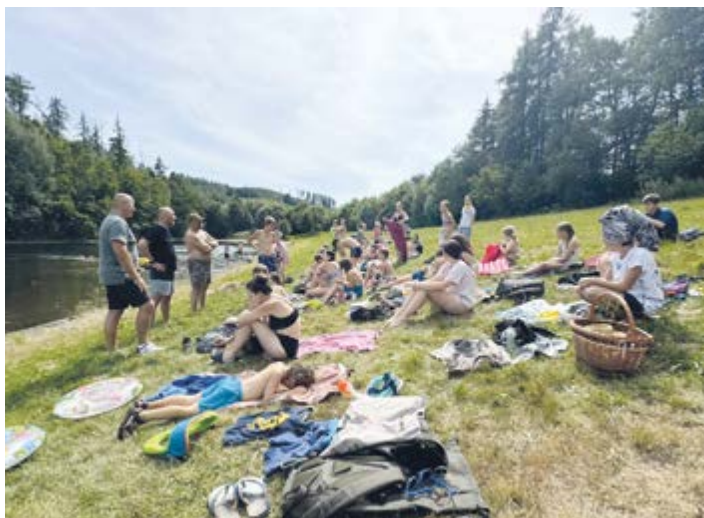
Děti v teplém počasí tráví čas u vody.