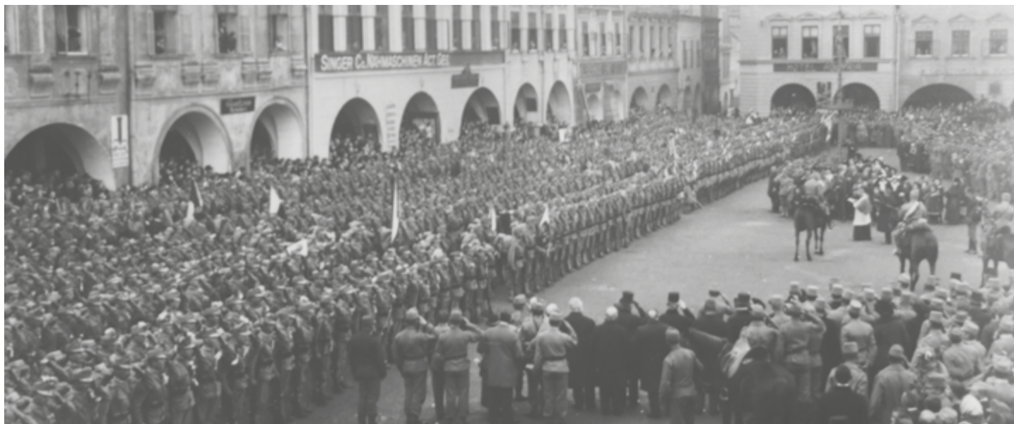
Nástup pěšího pluku č. 13 na novojičínském náměstí.

Ve dnech 7.–8. srpna 1915 byl záložní prapor pěšího pluku č. 13 Jung-Starhemberg v Novém Jičíně vystřídán zeměbranceckým pěším plukem č. 16 Krakov. Radek Polách, Muzeum Novojičínska