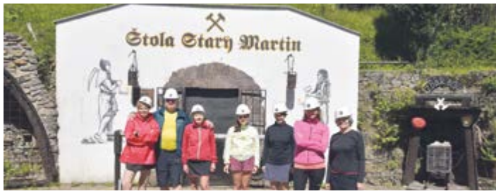
Hornická krajina kolem města Krupky nabídla také prohlídku štoly Starý Martin.

Na přelomu července a srpna jsme s odborem Klubu českých turistů, Turisti Nový Jičín, vyrazili na týdenní zájezd do severních Krušných hor. Počasí nám přálo, a tak jsme mohli procestovat spoustu zajímavých míst. Například lázně Bílina a Teplice, Duchcov se zámekem, kde trávil podzim života Giacomo Casanova, Osek s překrásným klášterním kostelem, zámek Jezeří, který se tyčí nad vytěženým hnědouhelným dolem a další. Památkou, která je zapsána na seznam UNESCO, je hornická krajina kolem města Krupky. Z tohoto města jsme vyjeli unikátní lanovkou na Komáří hůrku a někteří zavítali na prohlídku štoly Starý Martin. Poblíž města jsme si prohlédli zříceninu kostela sv. Prokopa. Také jsme zdolali schody několika rozhleden, jako Vlčí hora nebo Hláska na Svaté Kateřině. Naší pozornosti neunikly ani zříceniny Rýzmburk a Krupka, hrad Doubravka nebo zámek Červený Hrádek.