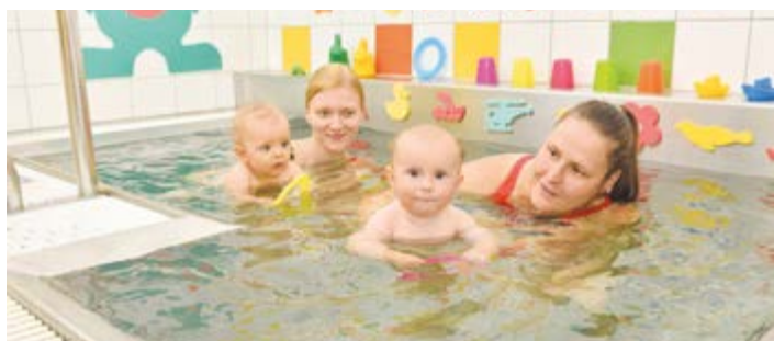
Plavání kojenců patří k činnostem Laguny.