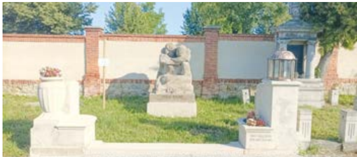
Hrob malíře Hugo Baara po zásahu restaurátora.