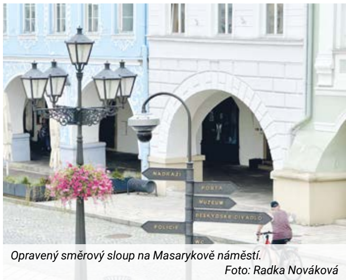
Opravený směrový sloup na Masarykově náměstí.