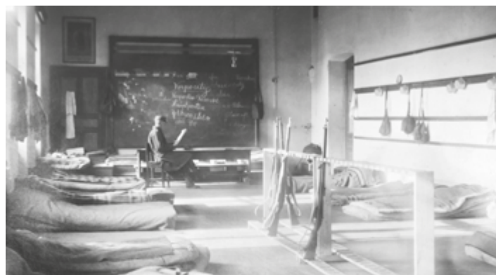
Rudolfův špitál (dnešní nemocnice), 1915.