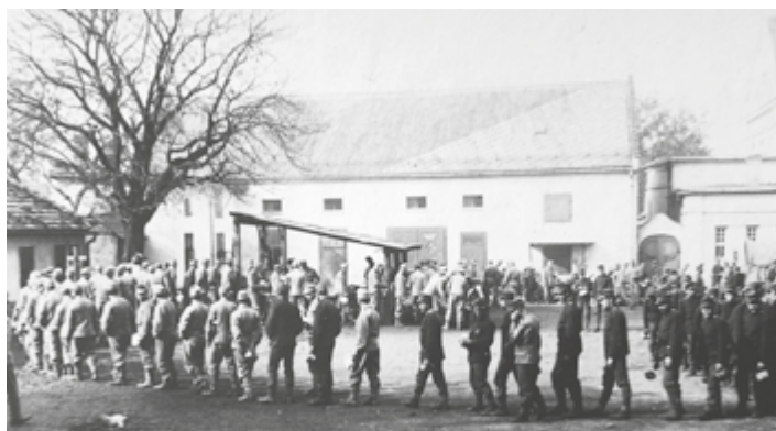
Fasování jídla pěšího pluku č. 13 v restauraci Nové Slunce, 1914.